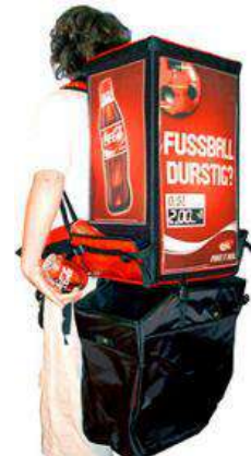
Pro 11 litros incl. Bolsa de basura