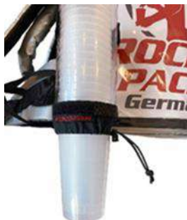
Dispensador de vasos universal para vasos desechables y reutilizables