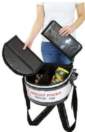
Tapa elevable completamente extraíble