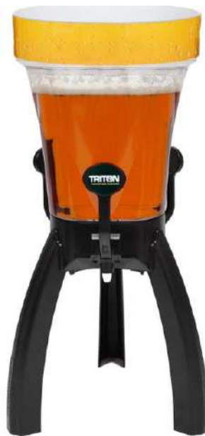
Clásica 5 Litros