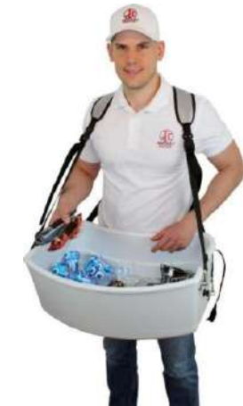
Bandeja de helado excl. Bolsa de aluminio y tapa deslizante