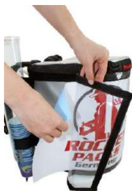
Decoración publicitaria flexible por

impresiones de papel detrás de papel de aluminio