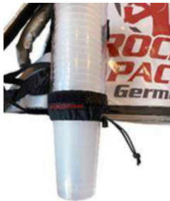
Dispensador de vasos universal para vasos desechables y reutilizables