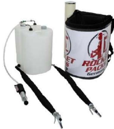
Ilustración: Características del producto para bebidas carbonatadas