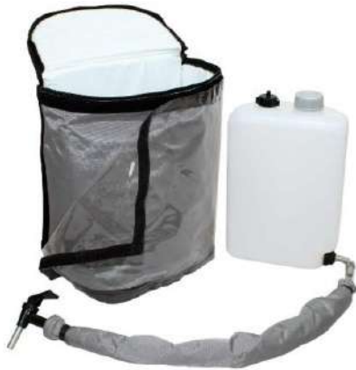
Ilustración: Características del producto para bebidas sin gas

Mochila para bebidas sencilla, con aislamiento moderado, apta para cualquier ocasión divertida. Preferiblemente adecuado para bebidas frías. Para bebidas sin gas, el vaciado funciona a través de alimentación por gravedad, no se requieren accesorios de presión adicionales. Cuando utilice la mochila con bebidas carbonatadas, la minibomba de aire debe funcionar como accesorio de presión.