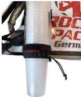
Dispensador de vasos universal para vasos desechables y reutilizables