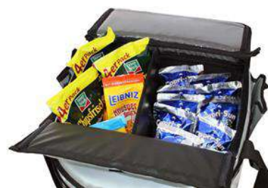
Embutido (separador de ambientes), mantiene la bandeja ordenada