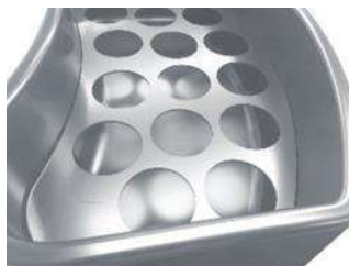
Ilustración con dos separadores