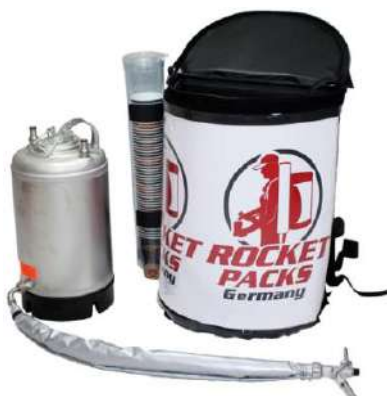
Ilustración: Características del producto para bebidas sin gas