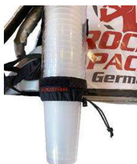
Dispensador de vasos universal para vasos desechables y reutilizables