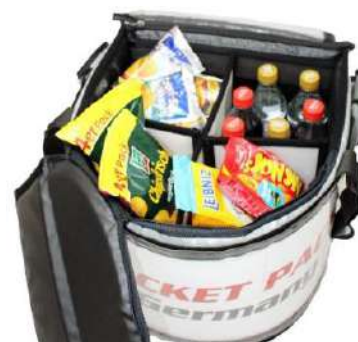
Embutido (separador de ambientes), mantiene la bandeja ordenada