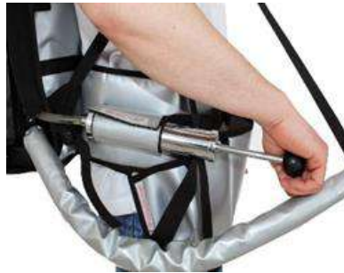
Bomba de aire manual como equipo a presión

* Otros accesorios de presión bajo pedido*