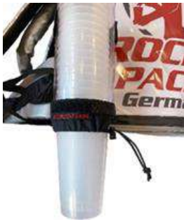
Dispensador de vasos universal para vasos desechables y reutilizables