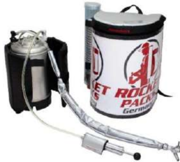
Ilustración: Características del producto para bebidas carbonatadas