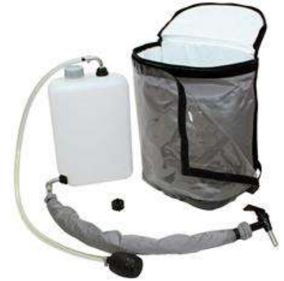
Ilustración: Características del producto para bebidas carbonatadas