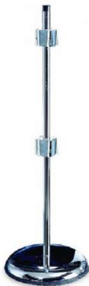
Solo de pie