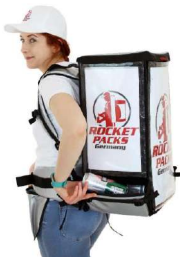
Intercambiables flexibles mensajes publicitarios!