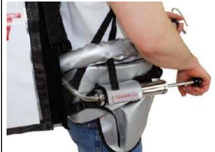
Bomba conectada al artículo Premium 11 litros