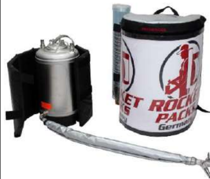
Ilustración: Características del producto para bebidas sin gas