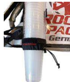
Dispensador de vasos universal para vasos desechables y reutilizables

...preferiblemente adecuado para bebidas frías!