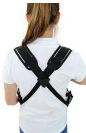
Sistema de correa de hombro ergonómico con hombrera ajustable

La bandeja aislada para proveedores es adecuada para una amplia gama de aplicaciones. Los materiales y la mano de obra de alta calidad garantizan estabilidad y durabilidad. La tapa abatible extraíble, el sistema de cinturones para los hombros con hombrera ajustable en la parte posterior transversalmente garantizan la máxima comodidad de uso. Con dos bolsillos exteriores laterales para accesorios de servicio o pochero. El frente y la tapa (interior) se pueden decorar con fines publicitarios. ¡Cuando se usa la bandeja con tapa también es adecuada para la distribución de productos de helado!