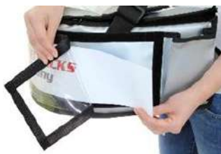
Cambio flexible de mensajes publicitarios