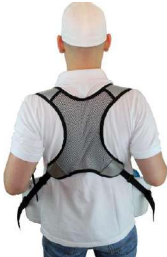
Ergonómico de 4 puntos bandolera

¡Ideal para Helados y otros productos congelados!