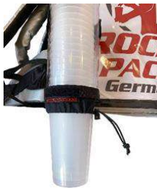
Dispensador de vasos universal para vasos desechables y reutilizables