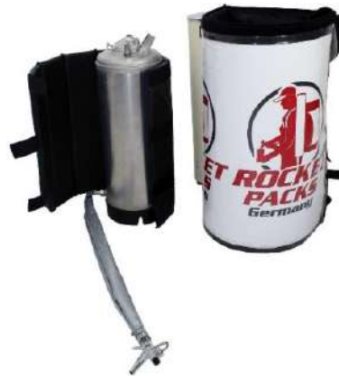
Ilustración: Características del producto para bebidas sin gas