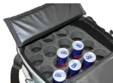
Agujero Ø 70 mm, Altura 50 mm