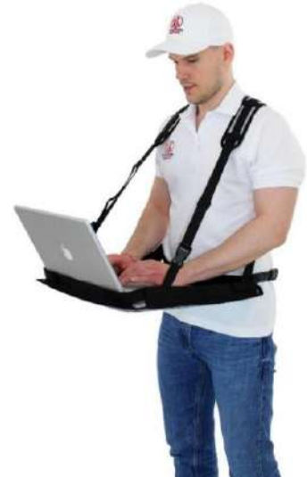
Sistema de cinturón Modelo XL

Soporte para portátil XL para aparatos 15"- 18"