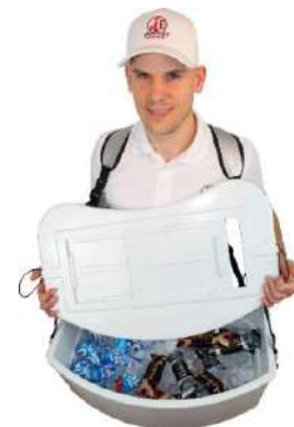
Tapa deslizante extraíble