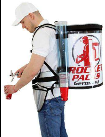
Mochila para bebidas profesional Aislamiento hasta 4 horas