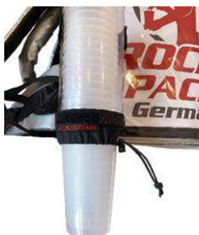
Dispensador de vasos universal para vasos desechables y reutilizables