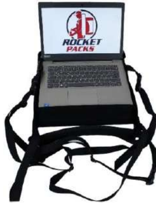
Imagen Versión XL