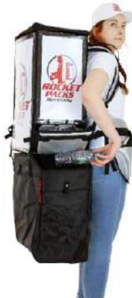
Paquete doble incl. Bolsa de basura