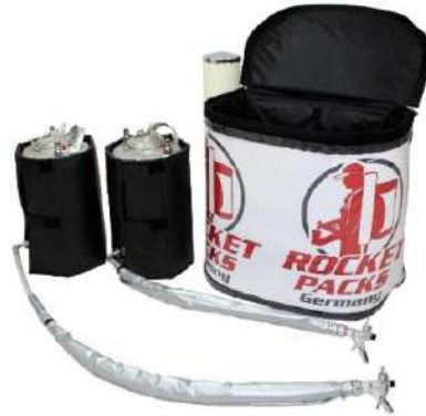
Ilustración: Características del producto para bebidas sin gas