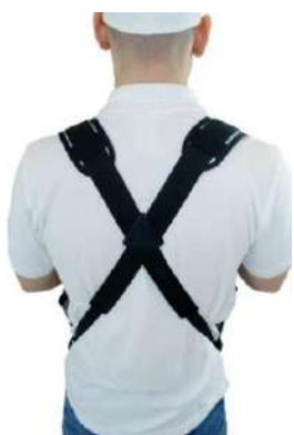
Sistema de correa de hombro ergonómico con hombrera ajustable

¡Especialmente adecuado para su uso con latas y botellas de 500 ml!