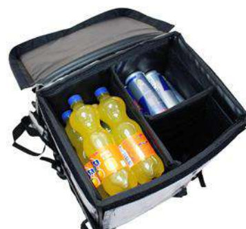
Dispositivo de 2 cámaras con capacidad de carga para 15 latas o botellas hasta 500 ml cada uno