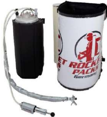
Ilustración: Características del producto para bebidas carbonatadas