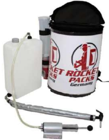
Ilustración: Características del producto para bebidas sin gas