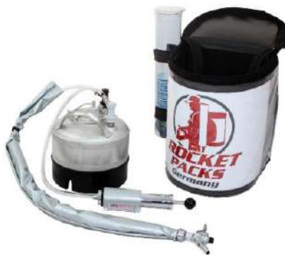
Bomba de aire manual como equipo a presión