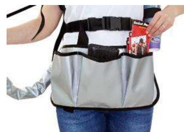
Delantal de vendedor incl. 3 bolsas delanteras