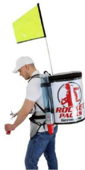
Promo-Flag con Pro 11 litros