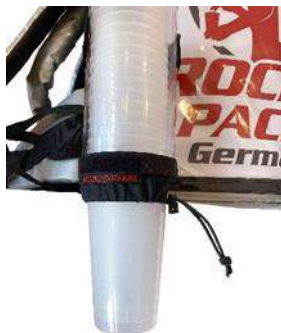
Dispensador de vasos universal para vasos desechables y reutilizables