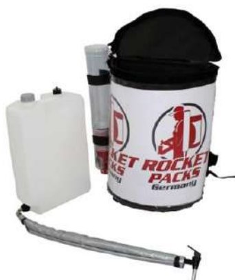
Ilustración: Características del producto para bebidas sin gas