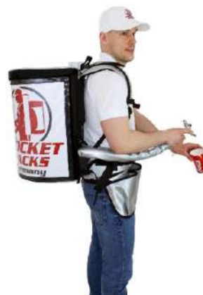
Pro de 11 litros, asegura una apariencia de marca profesional