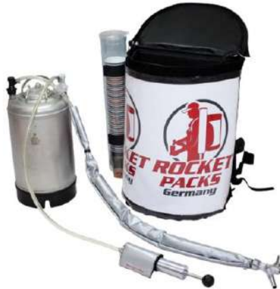
Ilustración: Características del producto para bebidas carbonatadas