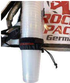
Dispensador de vasos universal para vasos desechables y reutilizables