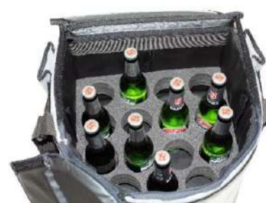
Agujero Ø 70 mm, Altura 50 mm