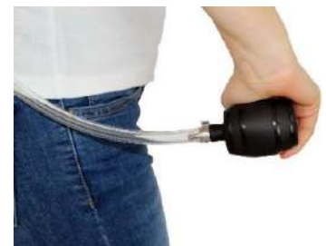
Funcionamiento con minibomba de aire como equipo a presión