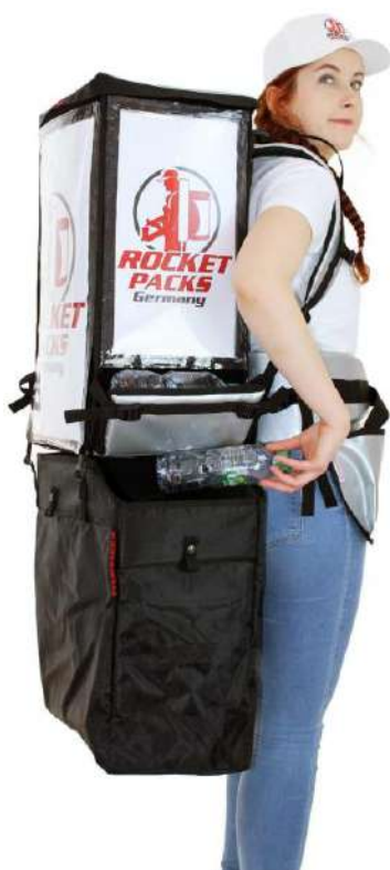
Twin Pack con bolsa de basura para envases

El Twin Pack se puede convertir en una mochila para bebidas para servir en vasos. Pregúntenos por soluciones y precios.