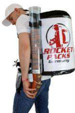
Dispensador de vasos para vasos de 100-550 ml