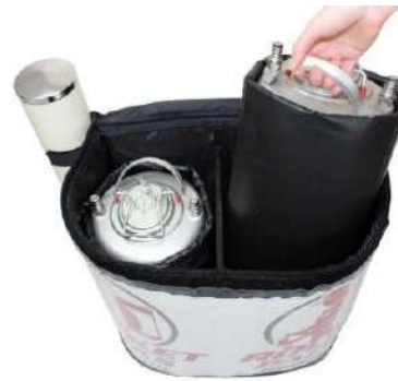
2 aislados por separado envases de bebidas de 11 litros