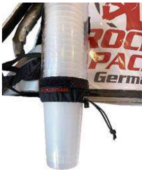
Dispensador de vasos universal para vasos desechables y reutilizables