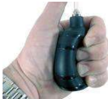
Mini bomba de aire