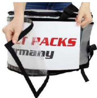
Cambio flexible de mensajes publicitarios