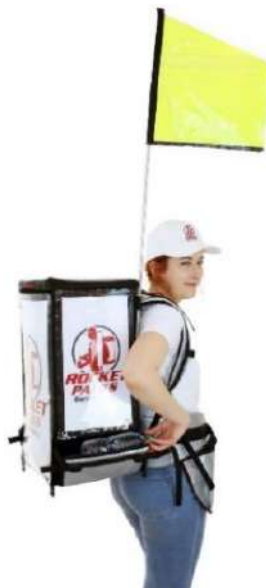
Bandera promocional con paquete doble