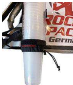
Dispensador de vasos universal para vasos desechables y reutilizables

Mochila de bebidas con aislamiento (hasta 2 horas). Para servir dos tipos de productos de una mochila. Preferiblemente adecuado para bebidas frías. Operación por gravedad de bebidas no carbonatadas, sin necesidad de utilizar equipos de presión adicionales. Dispensación de bebidas carbonatadas, se debe operar un equipo de presión adicional. La bomba de aire mecánica con acoplador en T es el método más adecuado para este propósito. ¡Ideal para servicio rápido de bebidas!