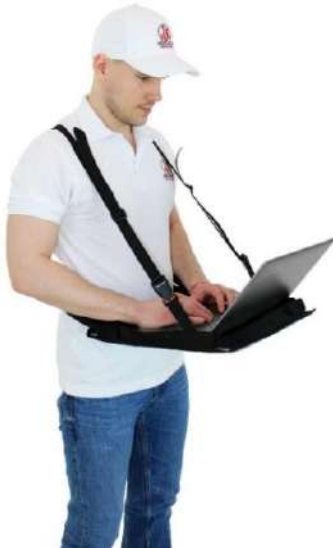
Sistema de cinturón Modelo estándar

Estándar de soporte para portátiles para dispositivos 11"- 14"