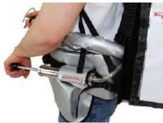
Bomba de aire manual como equipo a presión

* Otros accesorios de presión bajo pedido*