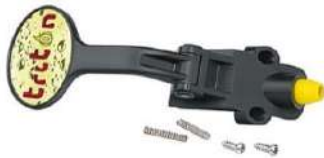
Toque con tornillos