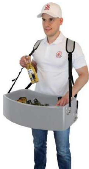
Ilustración excl. Bolsa de aluminio

- Bandeja de proveedor aplicable flexible hecha completamente de plástico -