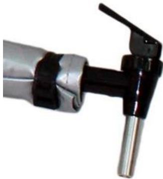
Grifo dosificador estándar